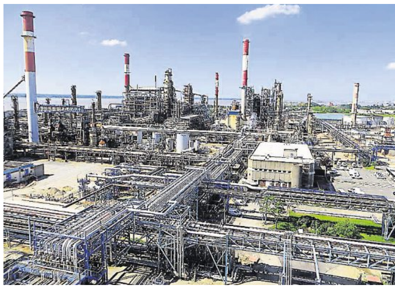
Entre dix à onze millions de tonnes de produits raffinés sortent du site de Donges en une année.

D'ici là, le groupe Total, rassuré sur l'engagement de principe des pouvoirs publics sur ce projet titanesque, devrait annoncer des évolutions pour son activité de raffinage. Un Comité