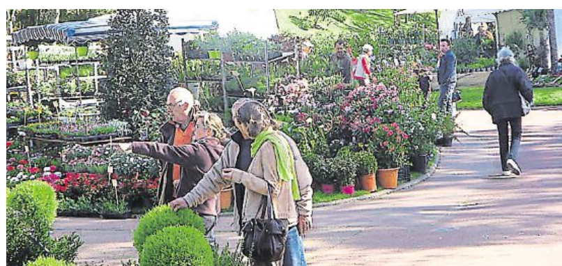
Quarante-six exposants seront au marché aux fleurs au parc des Dryades.

Parmi les quarante-six exposants, la priorité est accordée aux producteurs, dont un producteur de safran. Les promeneurs pourront également se procurer des produits dérivés, du miel au savon, en passant par les bijoux, et assister aux animations gratuites proposées par la Ville, particulièrement sur les chenilles processionnaires.